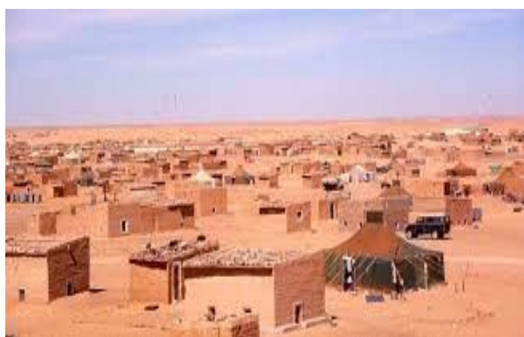
Tinduf en 2021