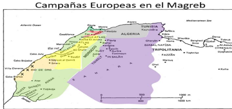
FIG. 5.1 The major regions of the Maghrib and the Sahara